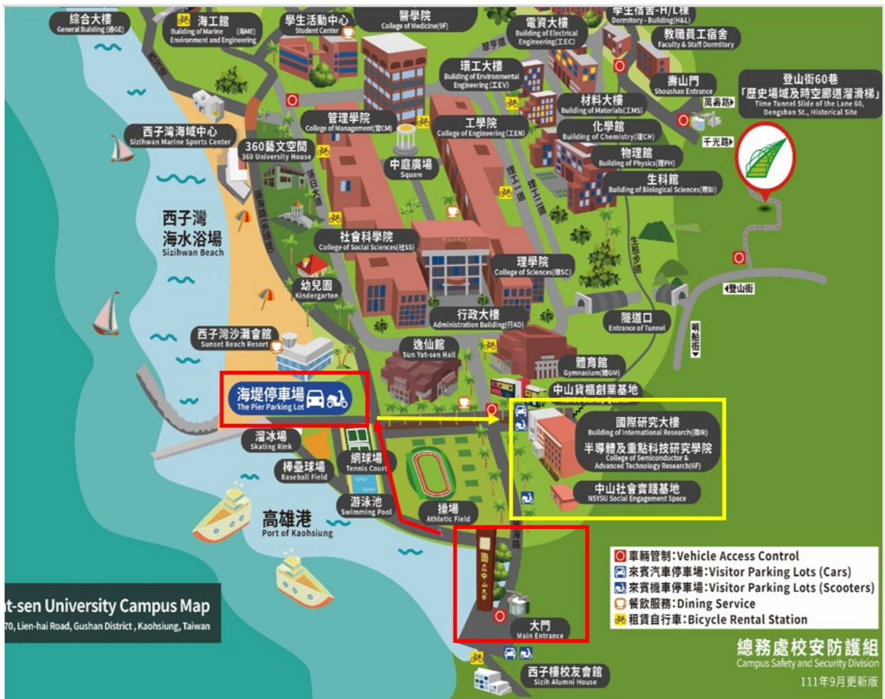
圖 1、海堤停車場與會場往返路線