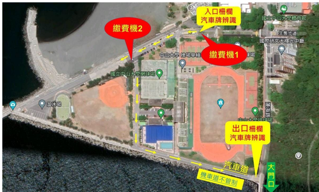
圖 2、海堤停車場繳費機位置