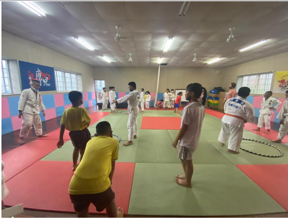
武潭國小至本校移地訓練