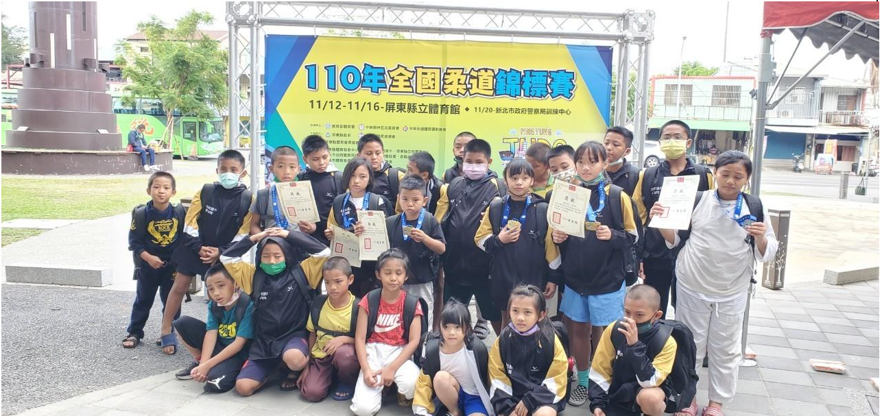
110 年全國柔道錦標賽